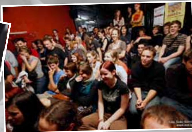
»Ojoj, zadrgo ima odpeto«