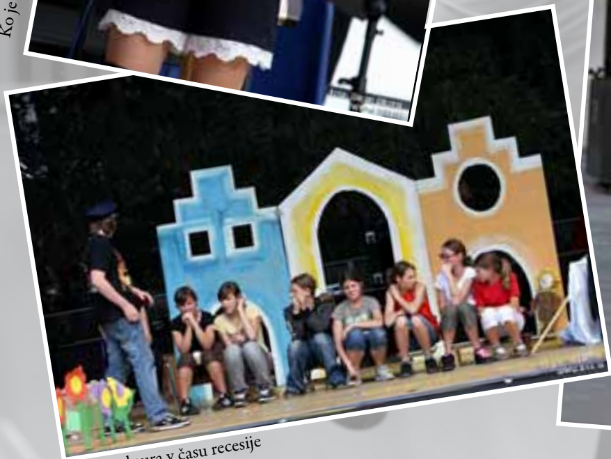
Arhitektura v času recessije