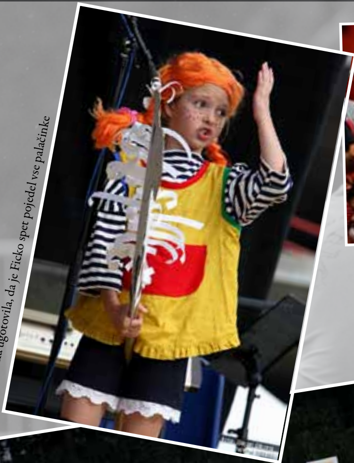
Ko je Pika ugotovila, da je Ficko spet pojedel vse palačinke