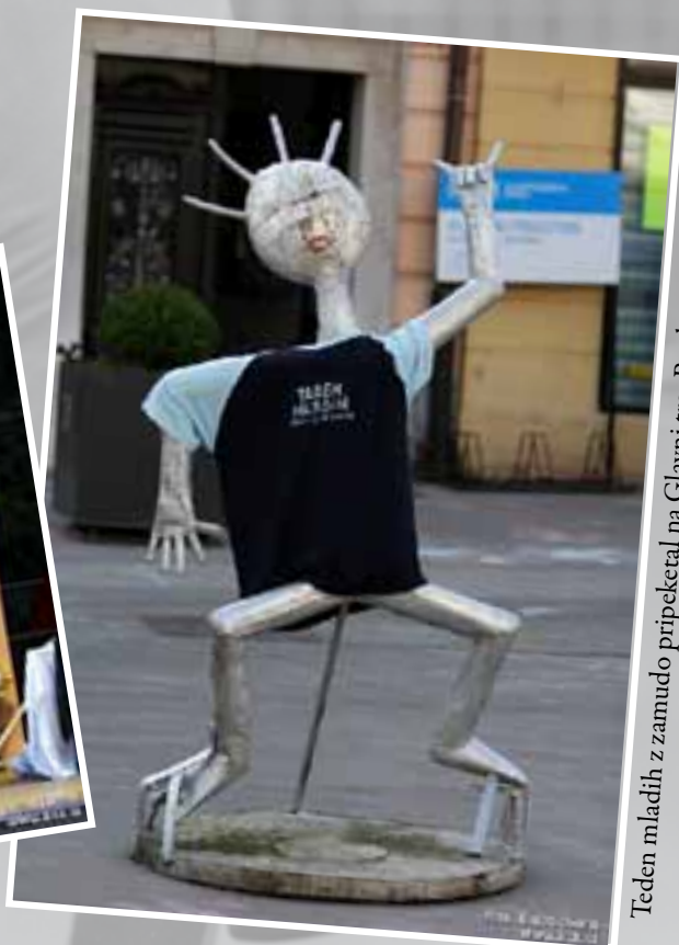
Teden mladih z zamudo pripeketal na Glavni trg, Rock on!