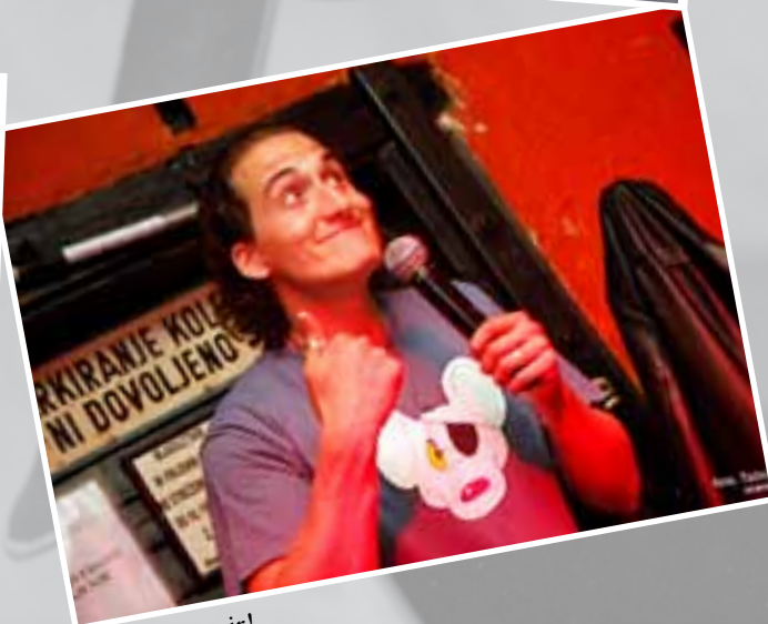
Mmmm ... sir!