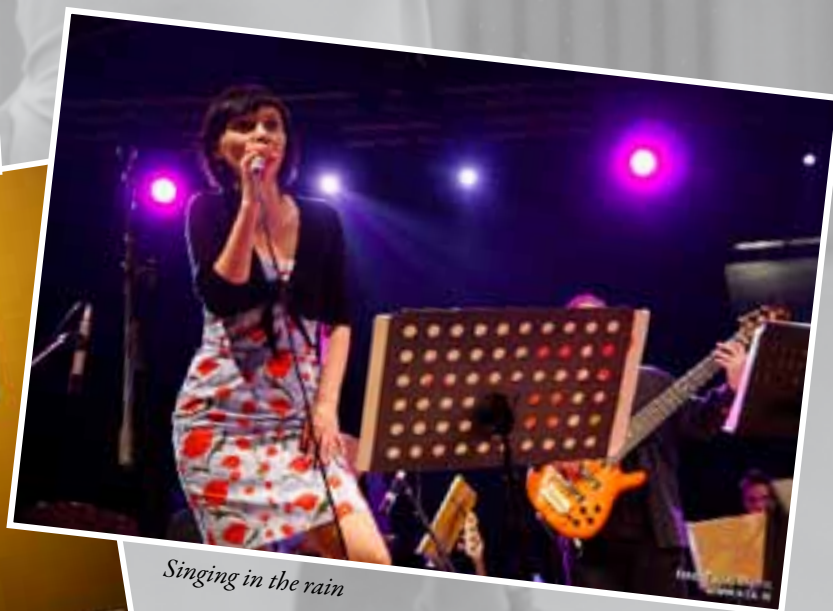
Singing in the rain