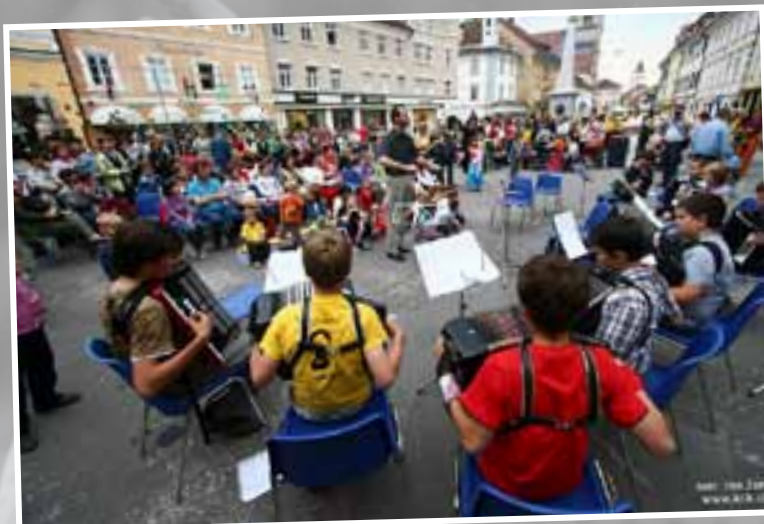
»Otoček sredi jezera, gori pa cerkvica«