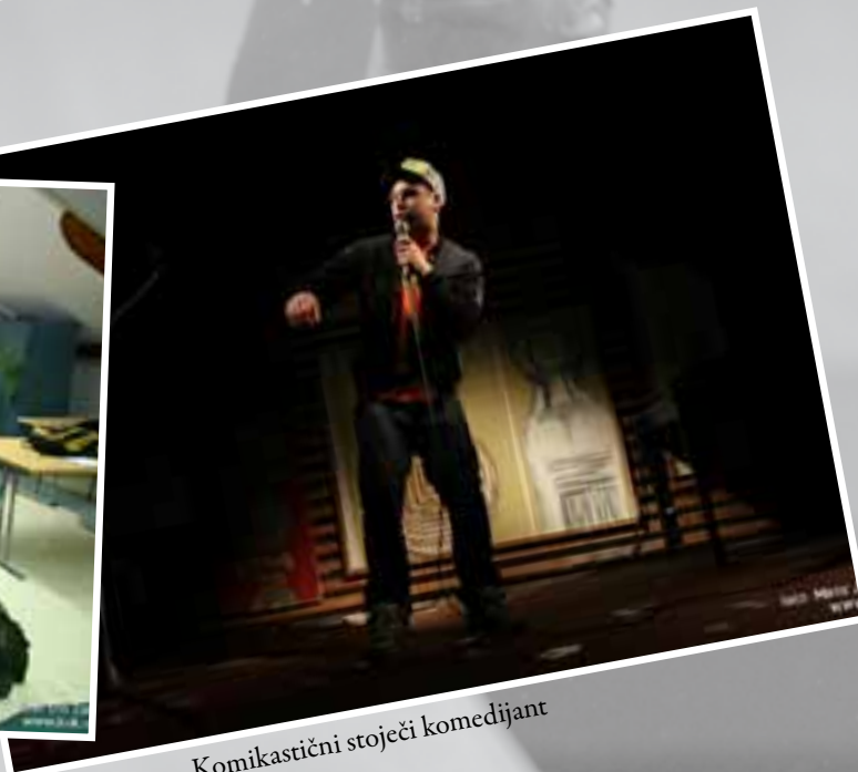
Komikastični stoječi komedijant