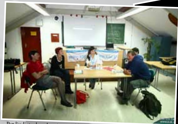
Pet ljudi + okrogla miza = velike ideje