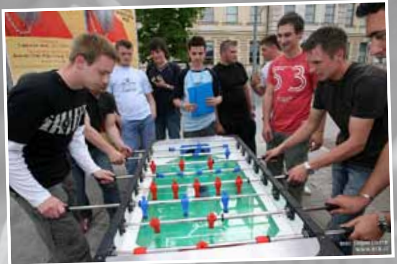
Samo navijačev Maribora ne pustite preblizu!