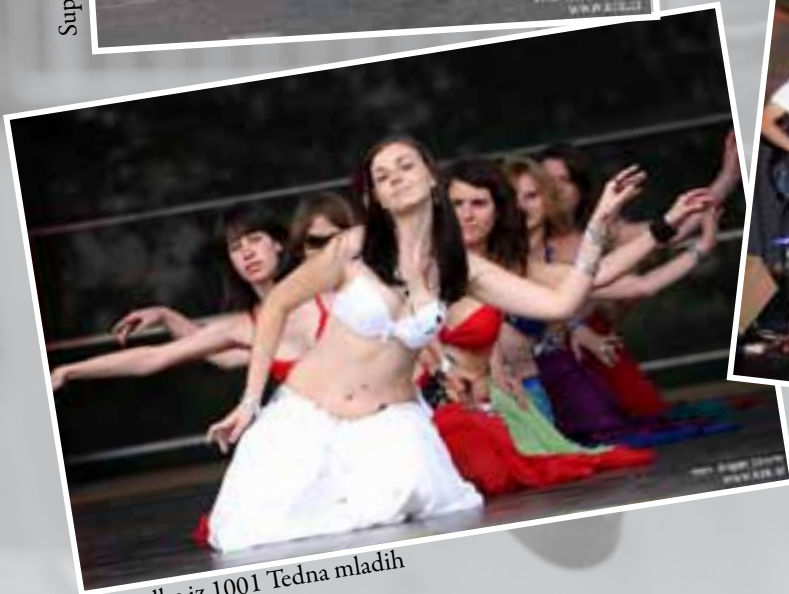
Zgodbe iz 1001 Tedna mladih