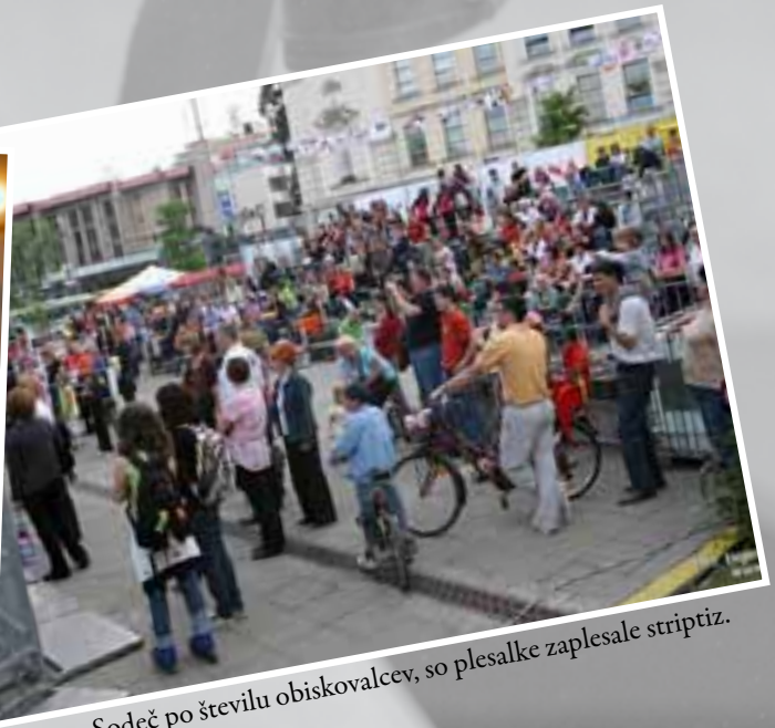
Sodeč po številu obiskovalcev, so plesalke zaplesale striptiz.