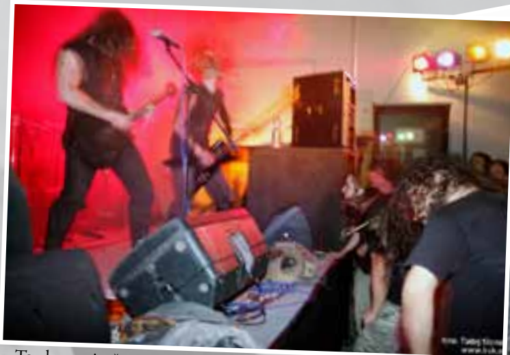
To, da so vsi v črnem, ni naključje