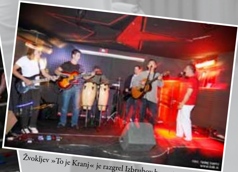
Žvokljev »To je Kranj« je razgrel Izbruhoval bazen!