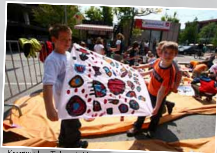
Kreativen krst Tedna mladih minuli petek