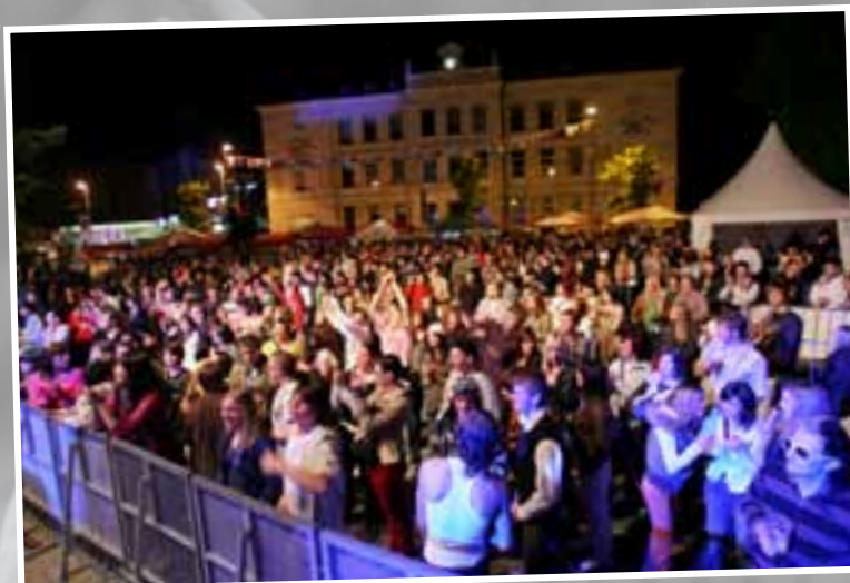
Epicenter dogajanja na Slovencu