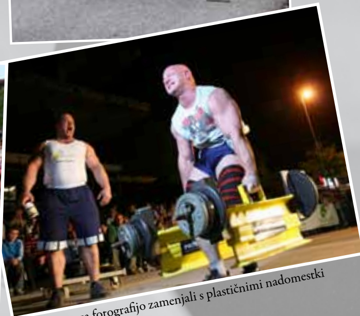
Uteži smo za fotografijo zamenjali s plastičnimi nadomestki